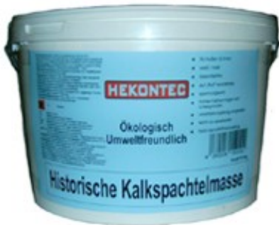
Eimer 15 Kg